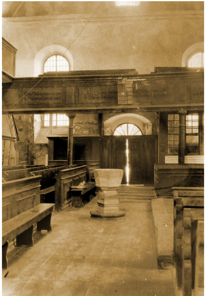
Innenansicht in Richtung Kirchenschiff, Foto vom TLD Erfurt, vor 1930 aufgenommen