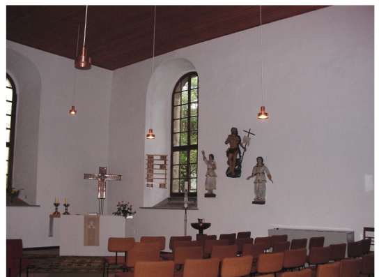
Innenansicht in Richtung Chor