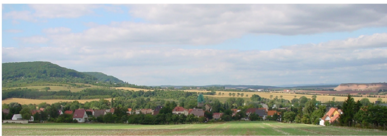
Ortsansicht von Südosten