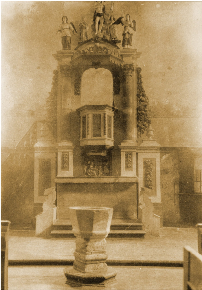
Innenansicht in Richtung Chor, Foto vom TLD Erfurt, vor 1930 aufgenommen