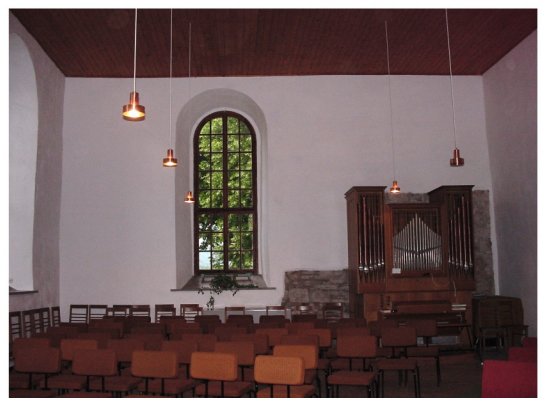
Innenansicht in Richtung Kirchenschiff

Turm: Länge 8 m, Breite 7 m, Höhe 36 m Turmhöhe / Kirchenlänge = 1,44