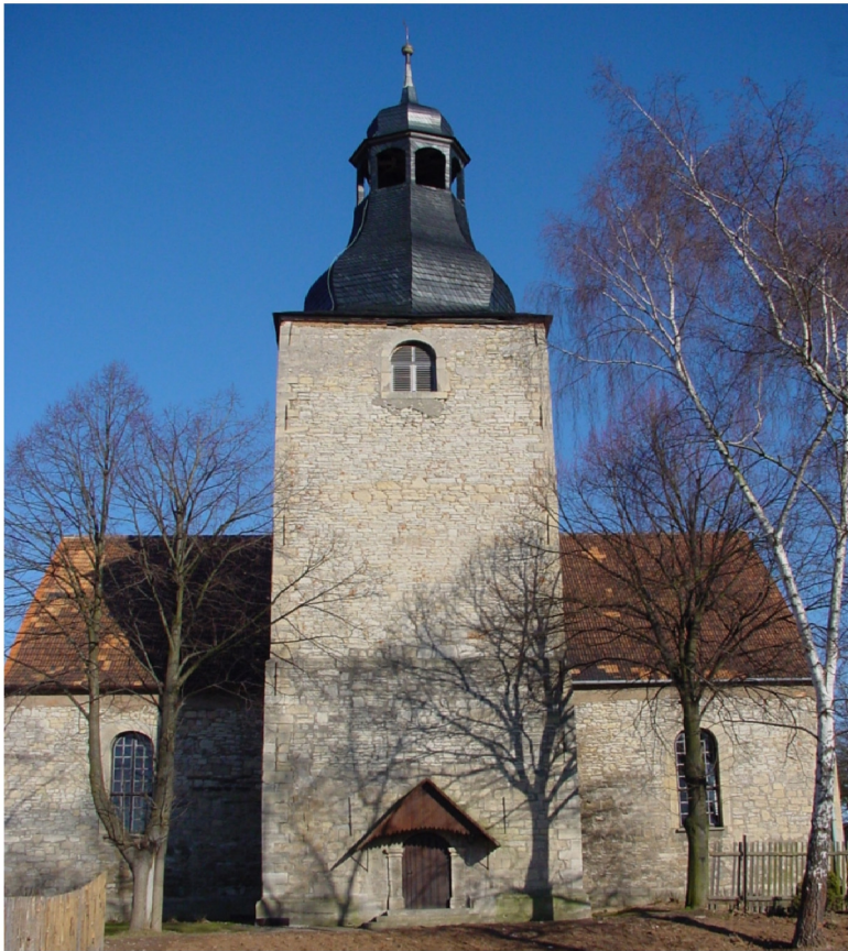
Kirchenansicht von Südwesten