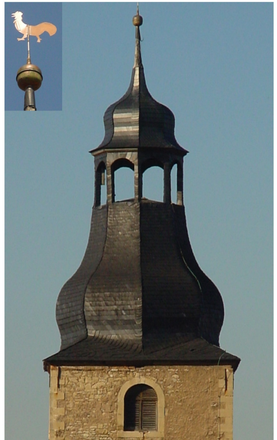
Südturm 36 m hoch mit welscher Haube