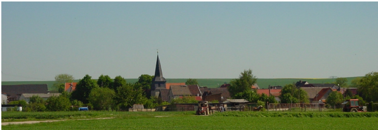
Ortsansicht von Süden