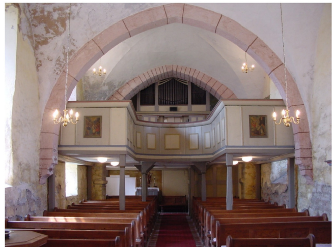
Innenansicht in Richtung Kirchenschiff