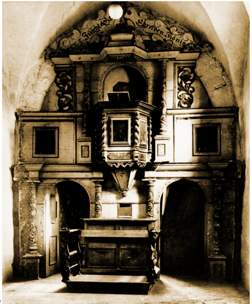
Barocker Kanzelaltar, Foto vom TLD Erfurt, aufgenom- men vor 1930