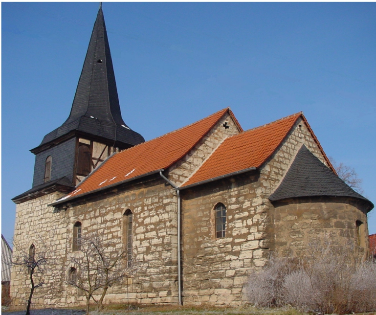
Kirchenansicht von Südwesten