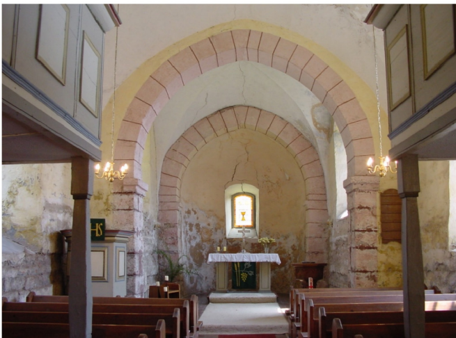
Innenansicht in Richtung Chor