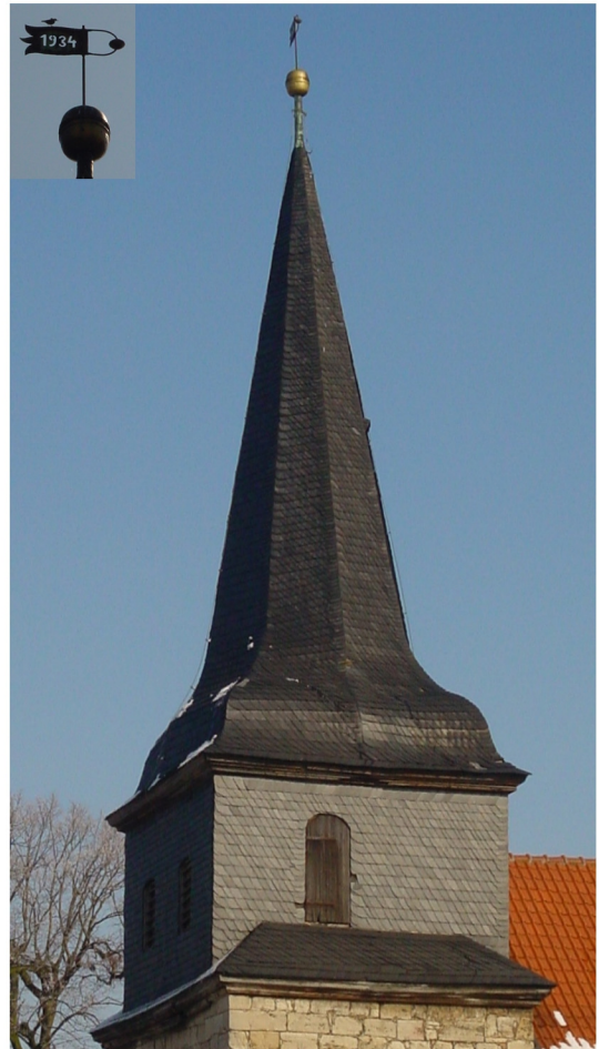
Westturm 20 m hoch mit oktagonalem Turmdach