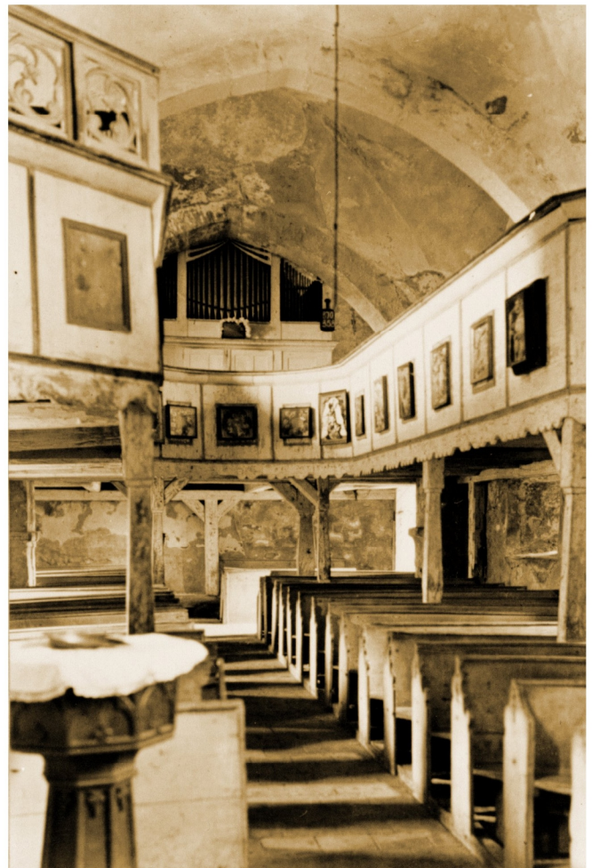
Innenansicht in Richtung Kirchenschiff, Foto vom TLD Erfurt, aufgenommen 1958