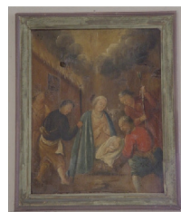
Bilder an der Empore