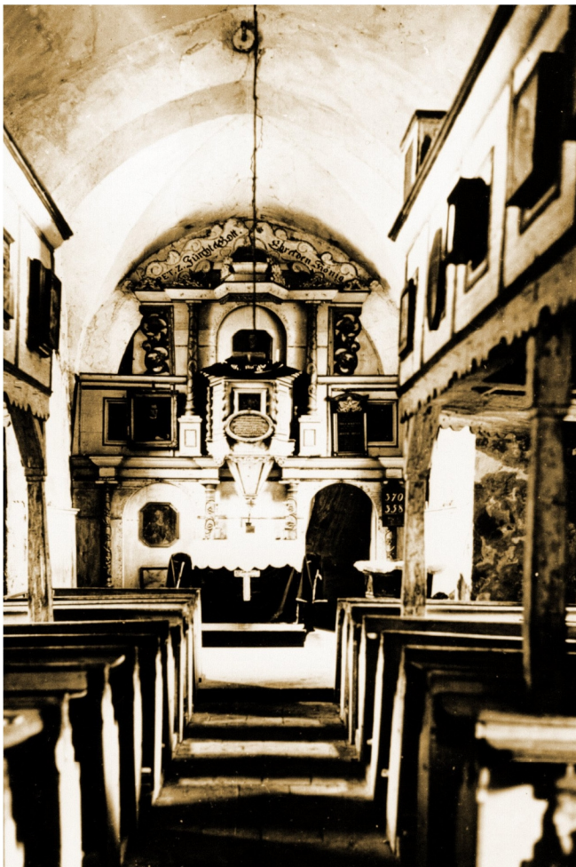
Innenansicht in Richtung Chor, Foto vom TLD Erfurt, aufgenommen vor 1930