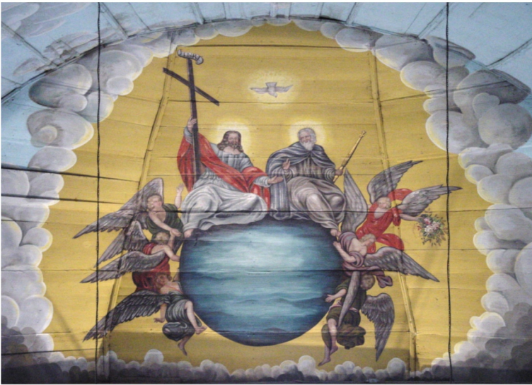
Bild über Altarraum