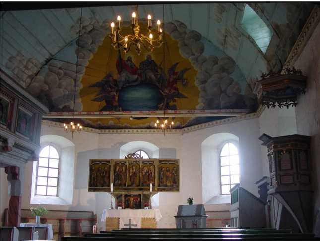
Ansicht in Richtung Altarraum