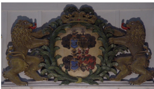
Wappen an der Orgelepore