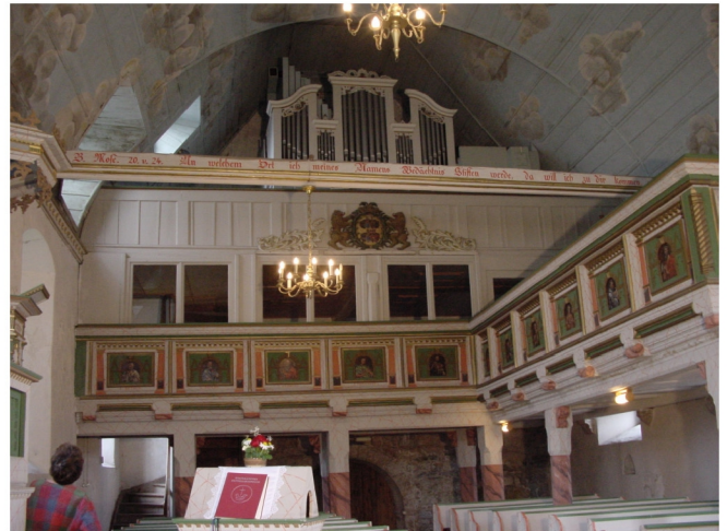
Bilder der Apostel an der Empore