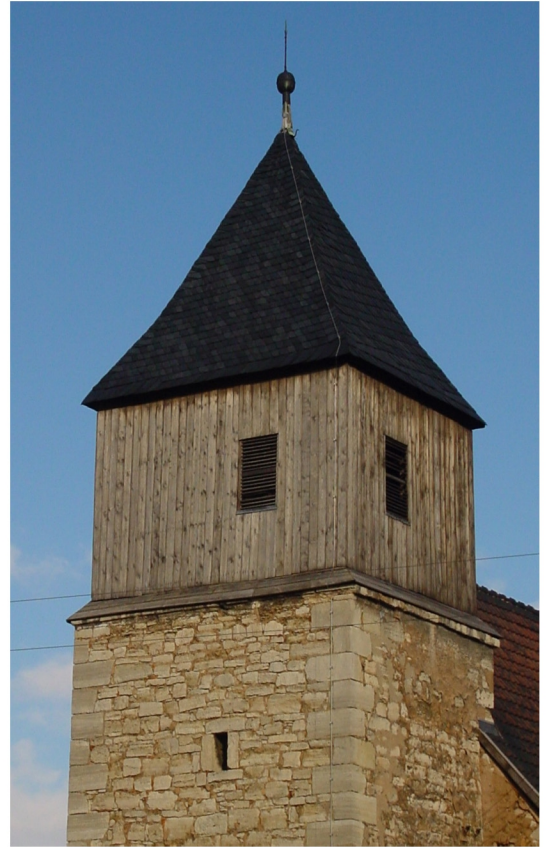
Westturm 18 m hoch mit Zelt Dach