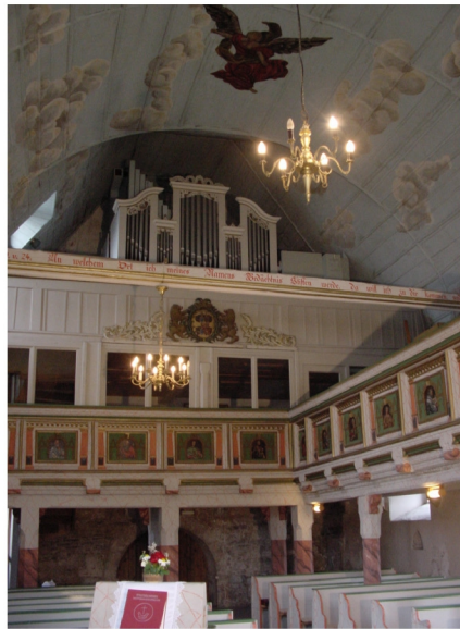
Innenansicht in Richtung Kirchenschiff