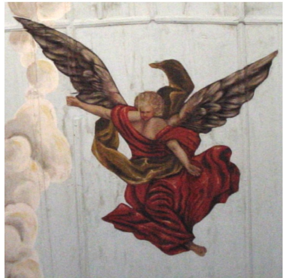
Engel und Wolkenbilder an der Holztonne