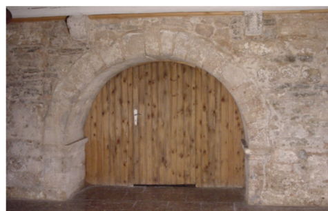
Romanischer Rundbogen im Turmuntergeschoß