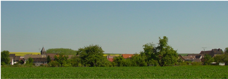
Ortsansicht von Süden