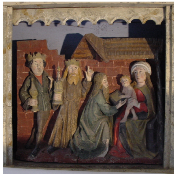
Unterer Teil des Flügelaltars