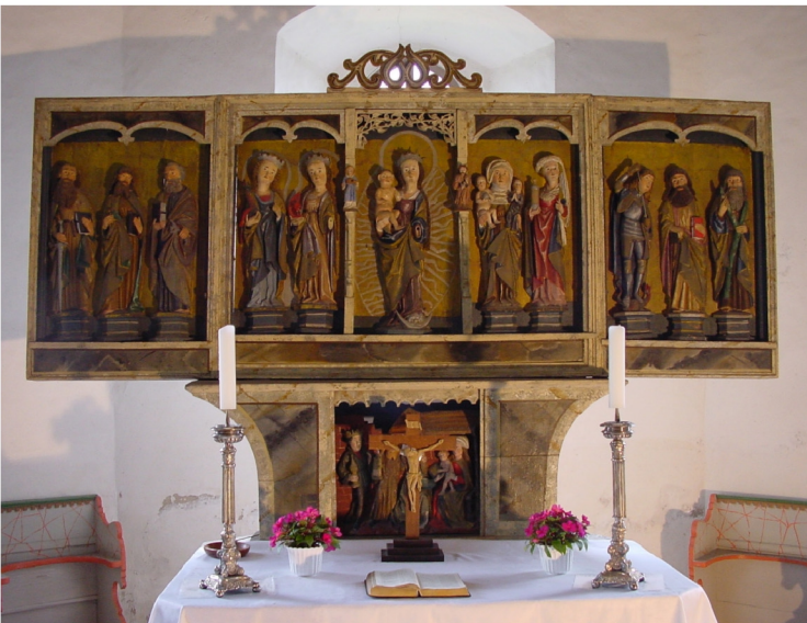
Geschnitzter Flügelaltar, um 1500