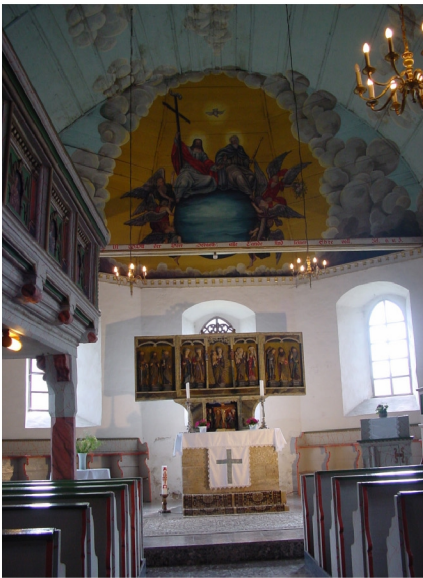
Innenansicht in Richtung Chor