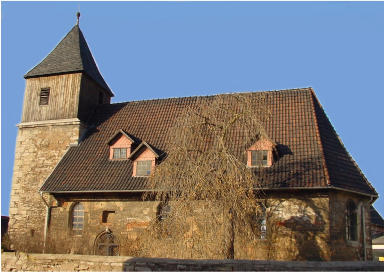
Kirchenansicht von Süden