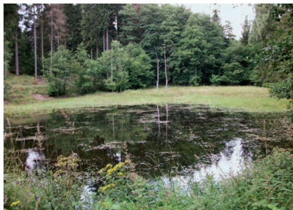
Schieferteich bei Stolberg

Neben farbenprächtigen Tag-Schmetterlingen und imposanten Käfern gehören Libellen zu den eindrucksvollsten und faszinierendsten Insekten unserer Heimat. Erste Vertreter der Ordnung Odonata, wie sie wissenschaftlich bezeichnet werden, existierten bereits zu Zeiten der Dinosaurier und konnten bis zu 70 cm groß werden.