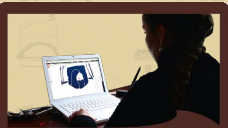
Biosphärenreservat Karstlandschaft Südharz

Links und rechts der Autobahn stehen sie schon, die Hinweisschilder auf den Naturpark Kyffhäuser, die Residenzstadt Stolberg, das Panorama in Bad Frankenhausen. Aber das direkt „vor der Haustür gelegene“ Biosphärenreservat, das in naher Zukunft noch mit einem UNESCO-Titel werben kann, findet der eilige Reisende nicht. Noch nicht, denn die Gestaltung eines ansprechenden Hinweisschildes ist derzeit bereits in Auftrag gegeben. In Kürze werden über die regionale Presse drei Entwürfe präsentiert, über die Sie, liebe Leser, entscheiden sollen. Welches Motiv stellt den Charakter, die Besonderheiten unserer Region am besten dar? Wir hoffen auf eine rege Beteiligung. Über die Abstimmungsmodalitäten und vielfältigen -möglichkeiten werden wir Sie Anfang März in den Medien und auf unserer Internetseite informieren. Es winken attraktive Preise, u. a. ein Wellness-Wochenende im Naturresort Schindelfbruch für 2 Personen!