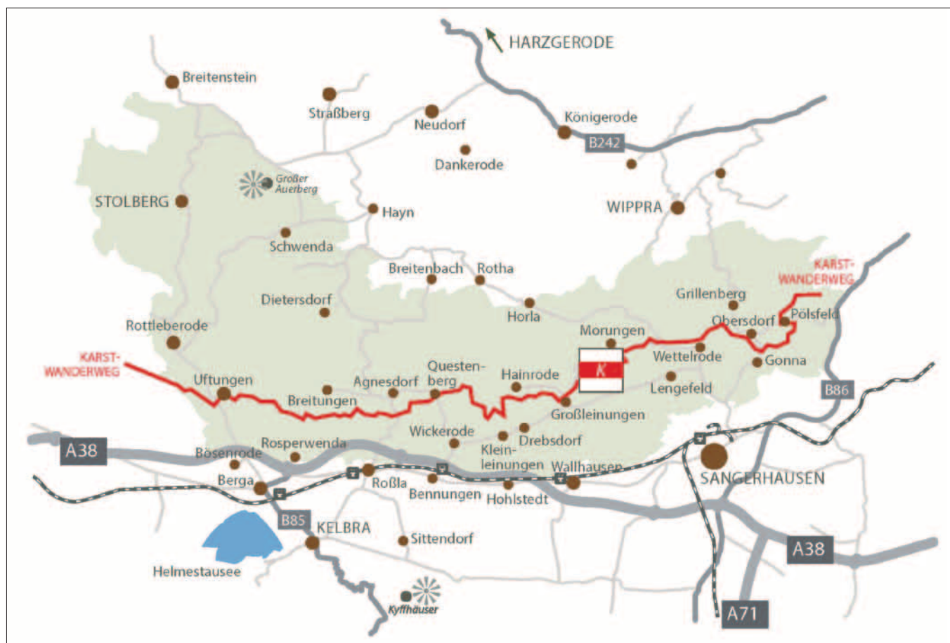
Abb. 1: Übersichtskarte des Biosphärenreservats Karstlandschaft Südharz mit Route des Karstwanderwegs; Grafik Biosphärenreservat Karstlandschaft Südharz.

Karstlandschaften in Anhydrit- und Gipsgesteinen weltweit. Es handelt sich um einen einzigartigen Verbund von speziellen Geo- und Biotopen. Auf Grund der hohen Löslichkeit der Untergrundgesteine entwickelt sich die Landschaft vergleichsweise hochdynamisch. Eingriffe in die Landschaft durch Bergbau und Infrastrukturmaßnahmen sind irreversibel. Die Landschaft lässt sich in ihrer Eigenart nicht gleichwertig renaturieren. Das betrifft die Landschaftsoberfläche, in besonderem Maße aber auch die Karstaquifere in ihrer Bedeutung für die Subrosion und den Grundwasserschutz. Das bestehende Biosphärenreservat Karstlandschaft Südharz kann als institutioneller Ausdruck für die Relevanz dieser Landschaft gelten. Die Erkundung oder gar Ausweisung von Anhydrit- und Gipslagerstätten im Südharz ist nicht nachhaltig und für die Substitution der REA-Gipse nicht notwendig. Vorhandene und bergrechtlich bewilligte Lagerstätten geben der bestehenden Gips-Industrie Bestandssicherheit für Jahrzehnte. Die vorhandenen Lagerstättenpotenziale sind auszunutzen statt neue, leichter abzubauen Vorkommen zu erschließen. Eine Neuausweisung von Gipslagerstätten zerstört wertvolle Landschaft unwiederbringlich und verhindert die Substitutionsanstrengungen für Naturgips durch Recycling.“