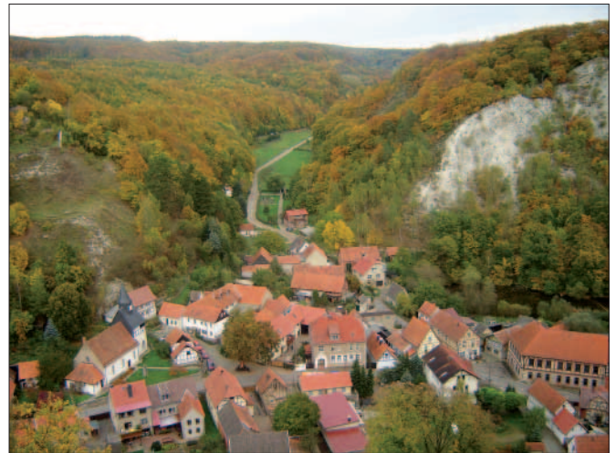
Abb. 4: Der kleine Ort Questenberg liegt mitten in der Gipskarstlandschaft, die durch den beabsichtigten Gipsabbau massiven Schaden nehmen würde; Foto Michael K. Brust.

„Ein konsequenter Ausbau der benötigten Infrastruktur stellt sicher, dass Knauf zukünftig die Recyclinganteile im Rohstoff Gips kontinuierlich erhöhen kann.“ Dies ist ein weiteres Zitat aus der Knauf-Website. Wie Sie wissen, lässt sich Gips hervorragend recyceln, es fehlt an der konsequenten Umsetzung! Der VdHK trägt dem zunehmenden Druck auf natürliche Ressourcen Rechnung und engagiert sich mit unseren europäischen und internationalen Dachverbänden unter anderem im United