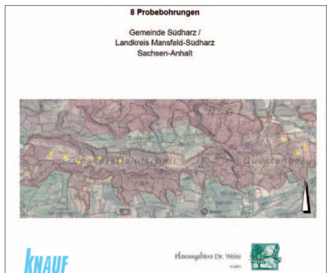
Abb. 3: Gutachten-Ausschnitt mit Lage der geplanten 8 Explorationsbohrungen, von denen letztlich 7 konkret beantragt sind; Quelle: Landkreis Mansfeld-Südharz.

Am Südharz ist im Laufe von mehreren 10.000 Jahren eine Gipskarst-Landschaft mit extremer Verkarstungsintensität, morphologischer sowie biologischer Vielfalt und Einzigartigkeit entstanden. Sie ist aus diesem Grund Teil der BfN-Hotspotgebiete der Biodiversität 18 und 19 und hat ganz herausragende Bedeutung für zahlreiche Fledermausarten, wie z.B. Mopsfledermaus Barbastella barbastellus , Große und Kleine Bartfledermaus Myotis brandtii und Myotis mystacinus sowie das Mausohr Myotis myotis , um nur einige zu nennen. Die strukturreiche Landschaft bietet auch vielen Amphibien wie z. B. dem Feuersalamander Salamandra salamandra Lebensraum. Auch sehr stark schwankende Wasserstände in großen Erdfällen und Poljen sowie periodischen Seen und Karstquellen gehören zu den Besonderheiten. Zudem zeichnet sich der Südharz durch eine besonders reichhaltige und schutzwürdige Grundwasserfauna