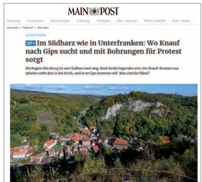
Abb. 5: Ausschnitt aus der Mainpost, Digitalausgabe vom 31.10.2024

Mit diesem offenen Brief möchten wir sicherstellen, dass die Firmenleitung sich der Tragweite dieses Ansinnens bewusst wird und nicht sehenden Auges zum Totengräber dieses Naturjuwels wird. Mit Ihrer Hilfe kann es zum Aushängeschild des Verantwortungsbewusstseins der Firma Knauf werden!“